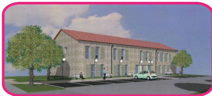
Perspective du programme

Niveau THPE (Très Haute Performance Énergétique)