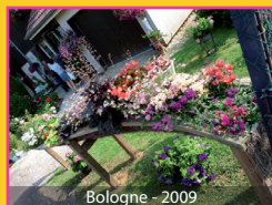
Bologne - 2009

Téléphone 03 25 32 33 00 Télécopie 03 25 32 22 28