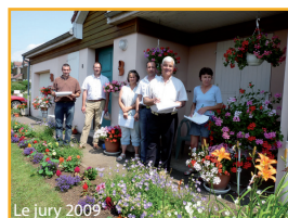
Le jury 2009

Date Limite d'inscription : vendredi 11 juin 2010