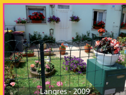
Langres - 2009

* Conformément à l'article 4 du règlement du concours, "Toute personne en situation d'impayés se verra refuser son inscription".