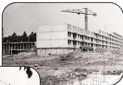
1957 : construction de la cité des Ouches