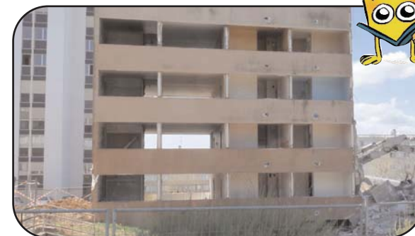
Les Dahlias ont été désamiantés, les menuiseries évacuées