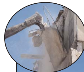
La pince grignote morceau par morceau