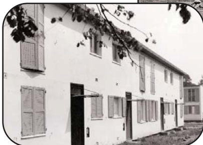
Turenne individuels (1958)

Des services naissent dans le quartier :