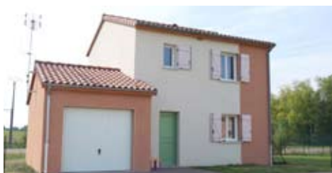
Le programme de Braucourt

Le coût global de cette opération s'élève à 930 000 euros TTC , soit 116 250 euros TTC/logement.