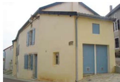
Le programme de Bourmont

Le programme est réalisé dans le corps d'un ancien bâtiment, donnant ainsi un cachet certain à cette construction. Les logements sont spacieux : 66m 2 pour un T2 et jusqu'à 82m 2 pour l'un des T3.