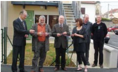
L'inauguration du programme de Bologne

Le coût global de cette opération s'élève à 1 100 000 euros TTC soit 91 666 euros TTC/logement.