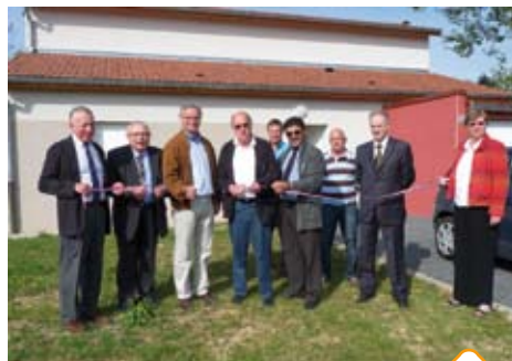
L'inauguration du programme d'Eclaron

Le coût global de cette opération s'élève à 1 520 000 euros TTC soit 101 333 euros TTC/logement.