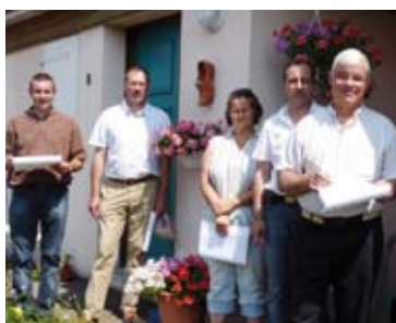
Les membres du jury 2009