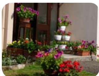
La fenêtre de M. Rapin