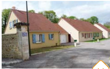
Le programme de Chateauvillain